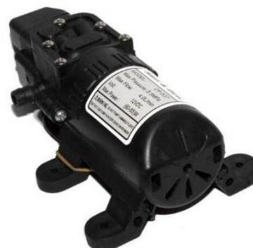
Gambar 4. Pompa Motor DC