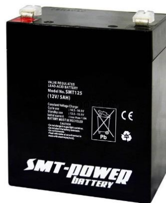
Gambar 3. Baterai / Accu