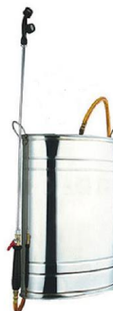
Gambar 5. Tangki Air

Tangki pestisida yang digunakan pada penelitian ini berkapasitas 15 liter. Tangki tersebut dilengkapi dengan stik sprayer, nozzle, dan tali pengait