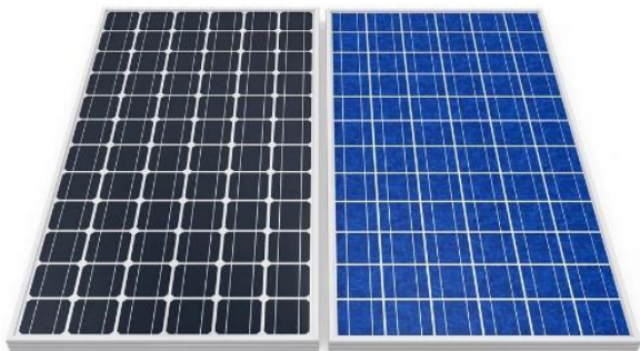
Gambar 1. Solar Panel