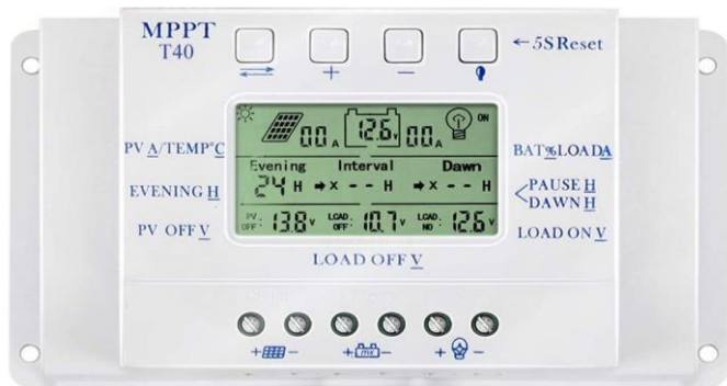
Gambar 2. Solar Charge Controller