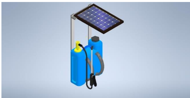
Gambar 7. Desain sistem alat penyemprot pestisida

Sistem tersebut memungkinkan penyemprotan dan pengisian ulang dilakukan oleh alat tersebut dengan menggunakan tenaga yang bersumber dari sinar matahari yang ditangkap oleh solar panel. Kemudian energi tersebut diubah menjadi energi listrik untuk dapat disimpan di baterai. Energi tersebut nantinya akan digunakan sebagai penggerak motor DC penyemprot ataupun motor DC pengisian ulang