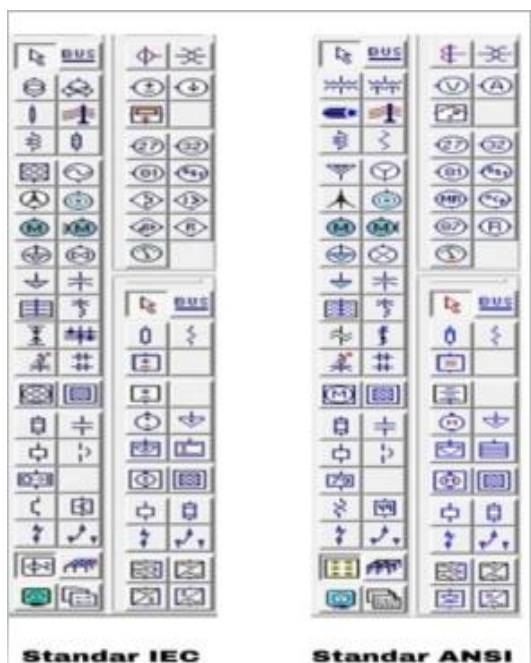
Gambar 3. Toolbar dari Elemen Etap 12.6 dengan standar IEC & ANSI